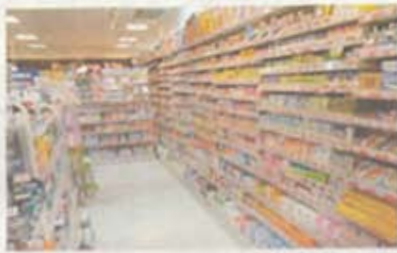
医薬品売場は清潔感のある白で統一。ビューティ売場との対比が面白い