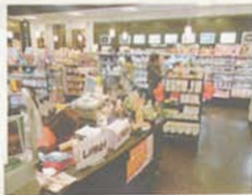
ビューティ売場は床から壁、棚に至るまで黒を採用。ドラッグストアとしては珍しい内装に仕上げた

同店がテナントとして、ワールドトレードセンター入る商業施設「アジア&ヒルズフエリーターミナシフィアクトレードセナル、有名なライブハウスター(ATC)」は、スナなどが立ち並びが大阪の